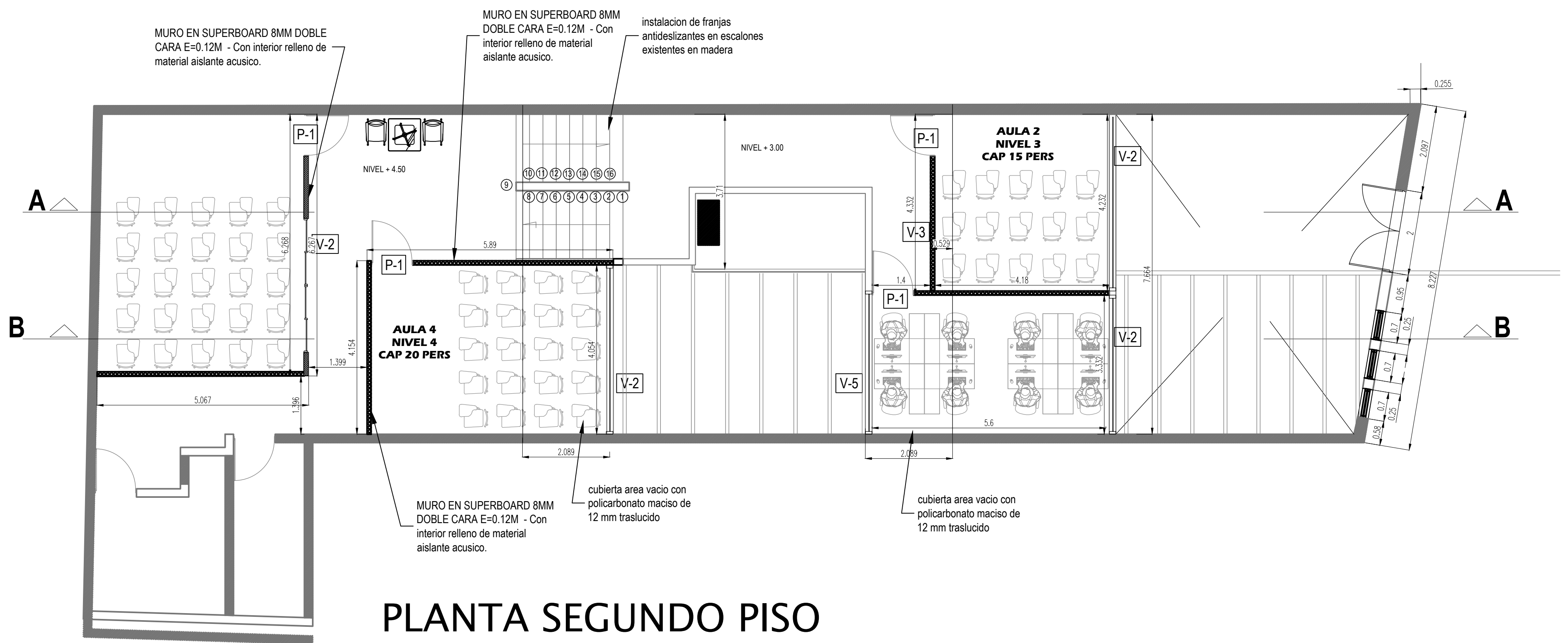
PLANTA SEGUNDO PISO