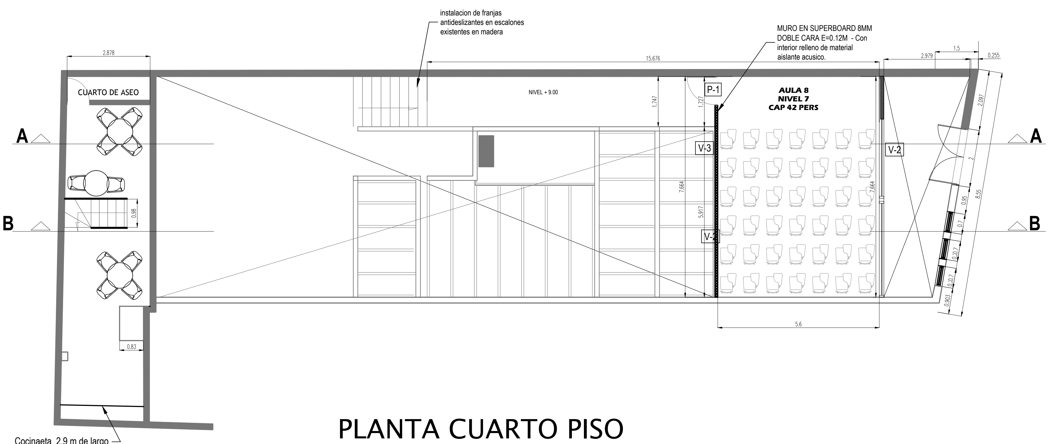
PLANTA CUARTO PISO