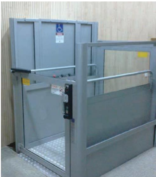
IMAGEN DE REFERENCIA PARA MODELO ABIERTO SIN DUCTO (Artes Visuales y C. Cultural)